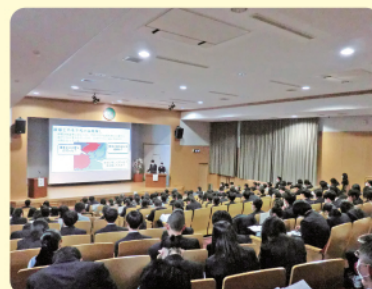
令和6年度 愛媛大学附属高等学校 課題研究代表者発表会