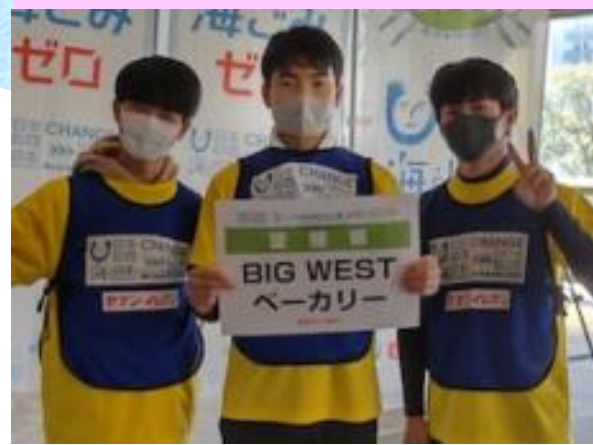
愛媛大学附属高校 「BIG WEST ベーカリー」

愛媛代表として2年連続出場した「スポGOMI 甲子園」では、2021優勝&2022準優勝！