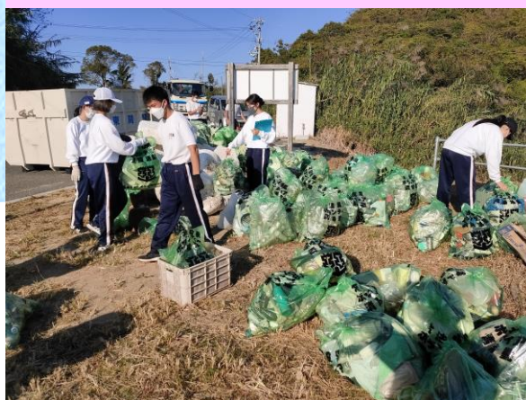
松山北高校 「愛顔グローバル部愛Landまつやま」

興居島をはじめとした島しょ部で、海岸清掃と環境保全意識の向上に取り組むメンバーです！